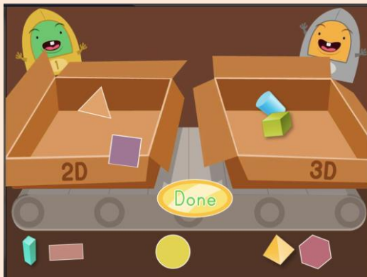
Παιχνίδι: Χωρίζω τα σχήματα σε επίπεδα και στερεά