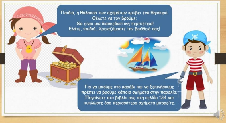
Video 1: Η Αναζήτηση του Θησαυρού