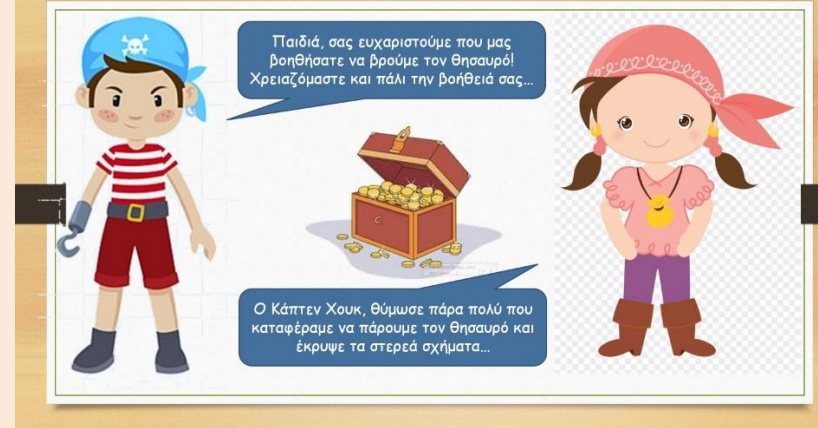
Video 1: Οι δοκιμασίες από τον Κάπτεν Χουκ