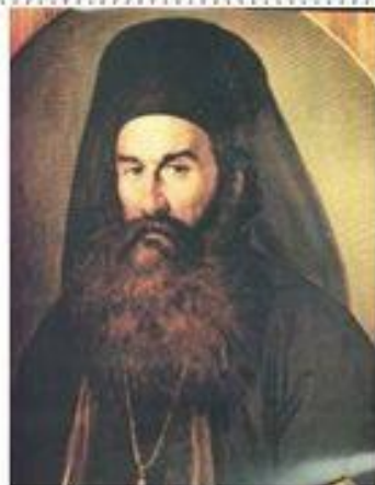
ΠΑΛΑΙΩΝ ΠΑΤΡΩΝ ΓΕΡΜΑΝΟΣ