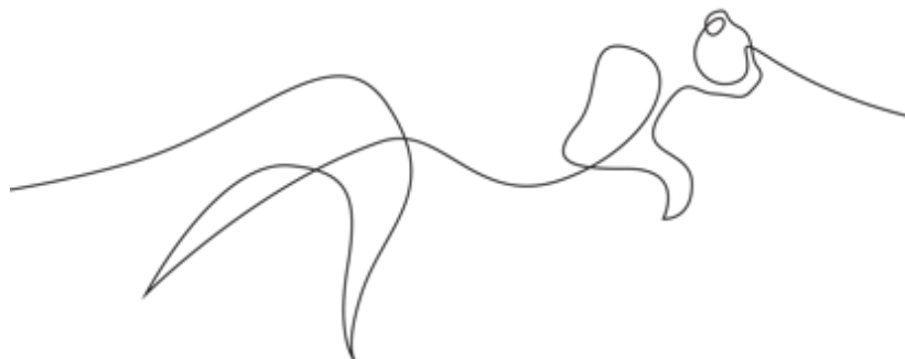
DFT "Wild Lines", Animation

3α. Δες πώς χρησιμοποιεί ο Γάλλος καλλιτέχνης DFT στη συλλογή έργων του «Άγριες γραμμές». Με τι μοιάζει;