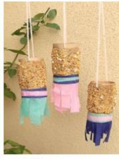
Ρολό με φυστικο-βούτυρο και σπόρους

Κατασκευές από http://archeia.moec.gov.cy/sd/271/drastiriottes_a_d.pdf