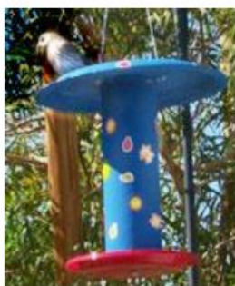
Ρολό, πιτάκια, σπόροι