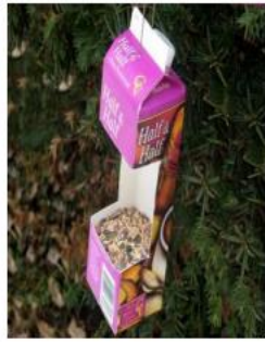
Κουτί χυμού / γάλατος