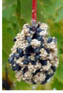
Κουκουναίρι με φυστικο-βούτυρο και σπόρους