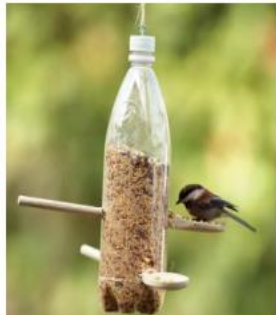
Μπουκάλι και κουτάλια